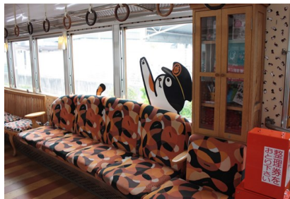
和歌山 貓 電車