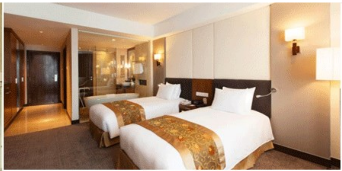
36 Le Duc Tho Street, My Dinh Commune | Tu Liem District, Hanoi 10000, Vietnam Tel: +1 877-859-5095