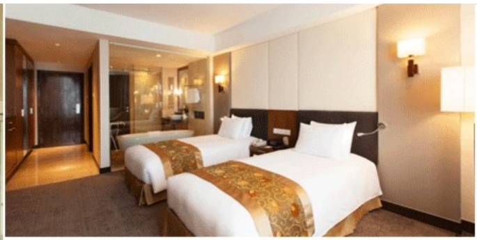
36 Le Duc Tho Street, My Dinh Commune | Tu Liem District, Hanoi 10000, Vietnam Tel: +1 877-859-5095