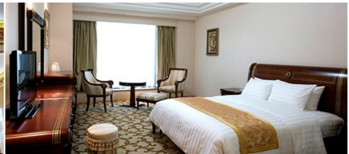
No.117 TRAN DUY HUNG STREET, TRUNGHOAWARD, CAU GIAY DIST, HANOI, VIETNAM Tel: (+84 4) 3555 1000