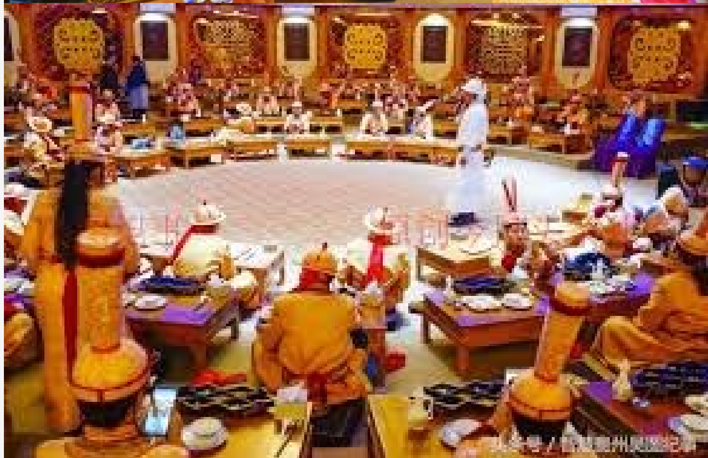
手把肉 是草原牧民最常用和最喜歡的餐食，即到草原觀光旅遊不吃一頓手把肉就算沒完全領略草原食俗風味和情趣。