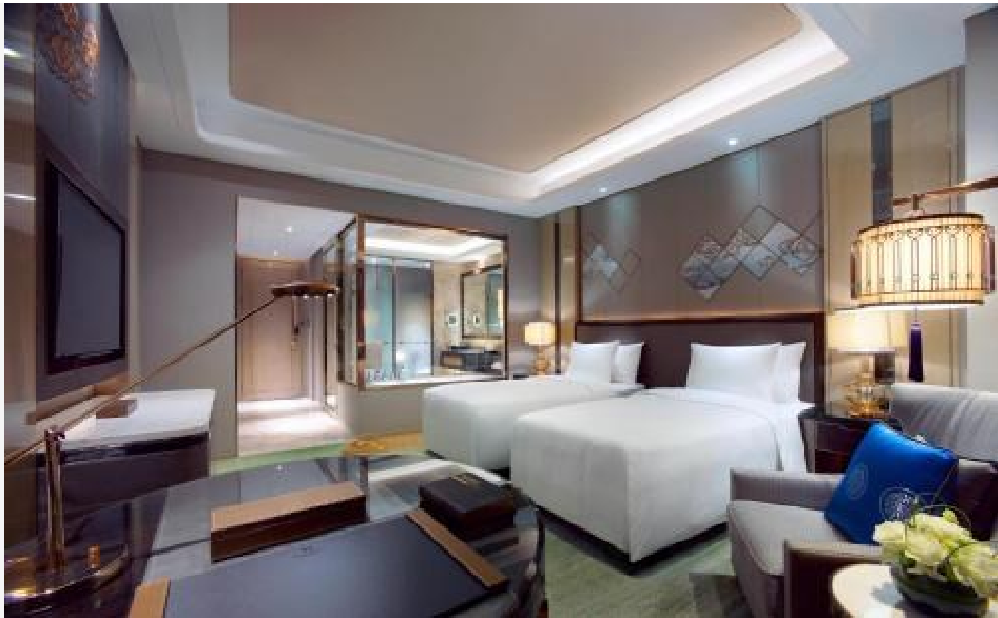
希拉穆仁 - 金帳蒙古包 或同級 這是一家集政務、商務、經濟、交通為一體的城市中心酒店，精心打造兩百餘間不同類型的房間，擁有會議室，可以接納不同規模不同類型的會議需求，並且有景觀餐廳、咖啡廳，快餐店，24小時便利店，供不同賓客的需求。酒店專註客人的住宿需求，全力打造舒適的睡眠質量和安靜、安全的人住環境。客房採用草本無硅油洗髮水、沐浴露，採用進口乳膠床墊，讓您的睡眠質量更好。馬桶專供“地爾水療全自動馬桶”品牌強強聯手，讓您的入住更加安全乾淨；房內還採用自動化窗簾、燈、藍牙音箱。讓您的入住更加時尚、便捷、安全、乾淨。