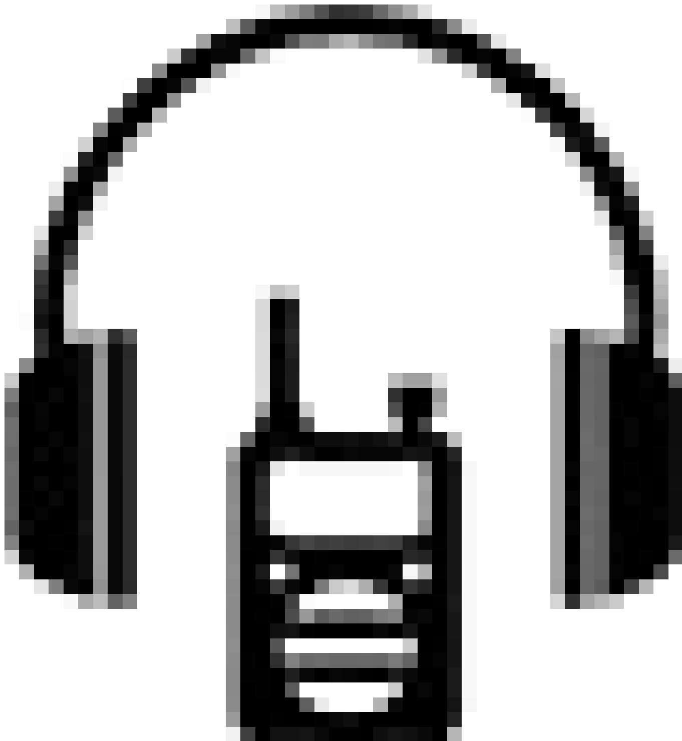
導覽耳機 每人一副，導覽內容不漏接。