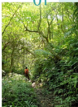
淡蘭茶道風情 四分子古道、獵狸尖步道