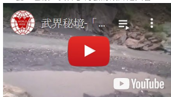
武界秘境-「車子溯溪」