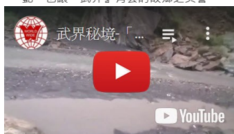
武界秘境-「車子溯溪」