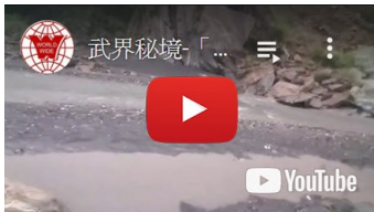
武界秘境-「車子溯溪」