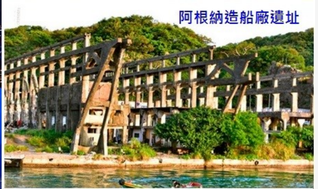
阿根納造船廠遺址