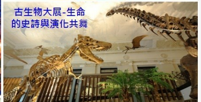
古生物大展-生命的史詩與演化共舞