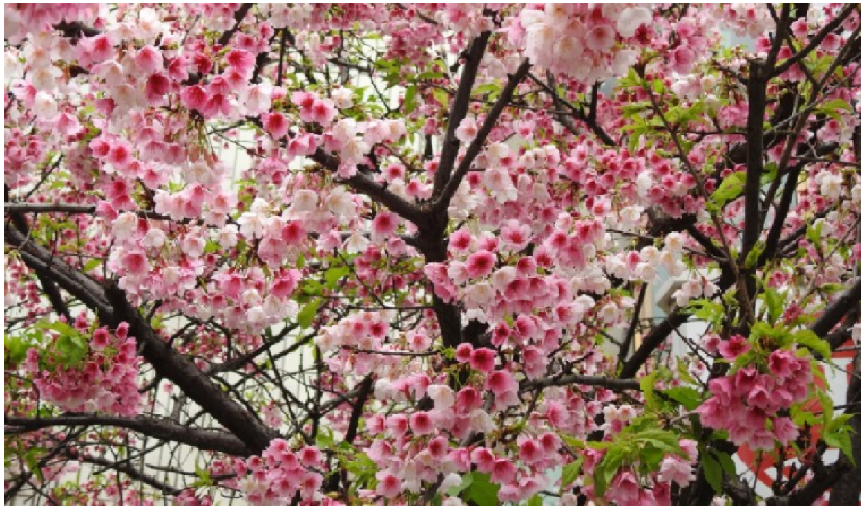
八重櫻繁春爛漫: (2/10-3/1)九族文化村歐式花園裡，櫻花正怒放。