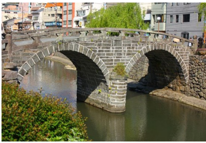
【長崎魚之町眼鏡橋】