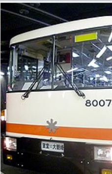
立山隧道無軌電車 10mis