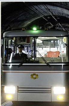
關電隧道無軌電車 16mis

立山登山纜車、立山驛、美女平 連結立山驛和美女平驛間的爬坡纜車，兩站間高低落差500公尺，但電纜車只需要2分鐘，坡度上升的很快很快，俯瞰的景觀當然與眾不同。