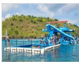
三島海域平臺水上活動