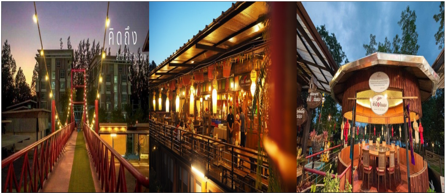
◆網紅景點天使瀑布公園:

經典的泰北料理與標誌性的泰式風格的建築，特別是餐廳入口處的一座紅橋，成為了最具標誌性的景色。傍晚十分，小橋流水，微風吹徐，享受著一道道的美味泰北佳餚。