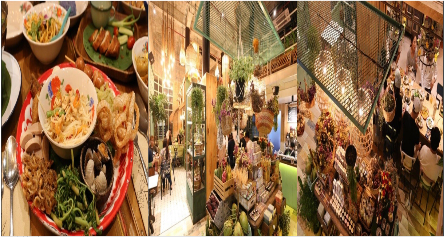
◆紅橋餐廳(米其林必比登推薦):

經典的泰北料理與標誌性的泰式風格的建築，特別是餐廳入口處的一座紅橋，成為了最具標誌性的景色。傍晚十分，小橋流水，微風吹徐，享受著一道道的美味泰北佳餚。