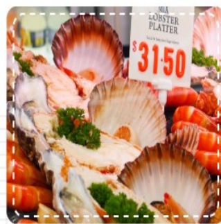
雪梨魚市場 Fish Market Sydney

此處魚類品種繁多，吸引各國旅客拜訪，氣氛熱鬧歡樂。海濱購物中心內設有各種不同口味的餐廳，您不妨自費品嚐當地新鮮的海產佳餚，絕對回味無窮。在世界知名的衝浪者天堂享受細白純淨的沙灘、親近美麗的澳洲海洋，也可在逛魚市場時自費品嚐現撈新鮮海味。今天您會更徹底愛上雪梨這座與海合一的魅力城市。