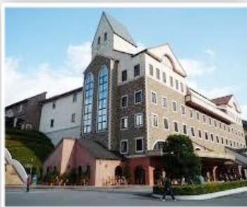
今治毛巾購物中心