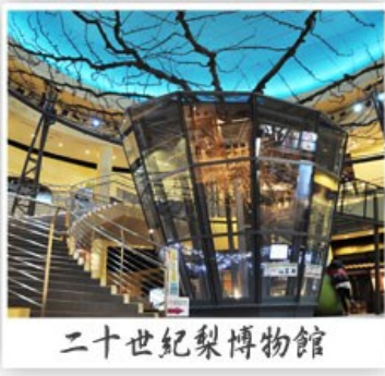
二十世紀梨博物館