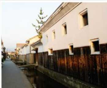
倉吉白壁土藏街道