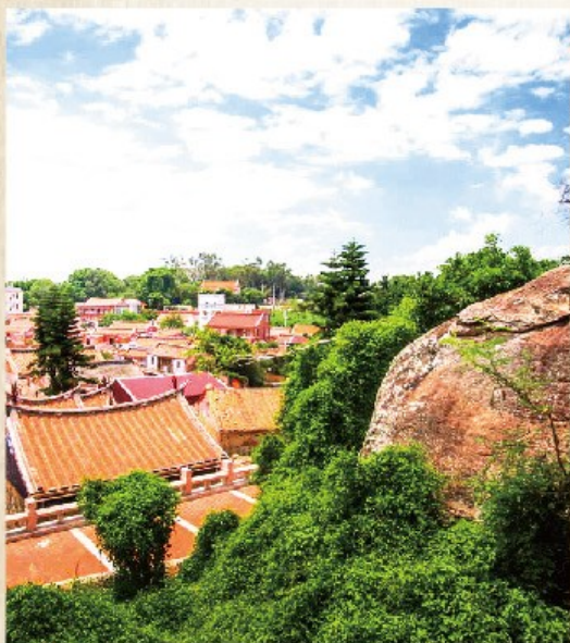
◦ Zhushan ◦

珠山位在金門本島的西南方、環島西路起點，這裡是一個薛氏單姓聚落，薛氏祖先在元朝由廈門薛嶺的前來定居，至今已經有 650 年歷史。珠山聚落四周高地環繞，而中間有大潭，呈「四水歸塘」的風水吉穴，整個聚落以宗祠為中心向兩邊拓展，環繞大潭而建，古老磚牆的赭紅與清澄潭水的沉綠相互輝映，都是珠山聚落不可錯過的精彩。