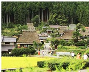
美山町合掌屋聚落