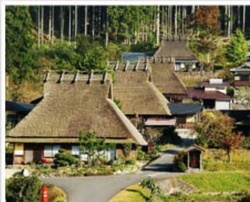
美山町合掌屋聚落