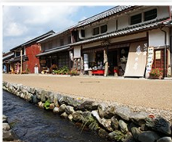
若狹鯖魚街道熊川宿

※行車時間參考：水月花飯店→(40分)若狹鯖魚街道→(20分)瓜割瀑布→(15分)明通寺→ (20分)福井傳統工藝→(1 小時40分)宮津溫泉