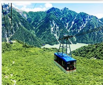
立山黑部~大觀峰纜車