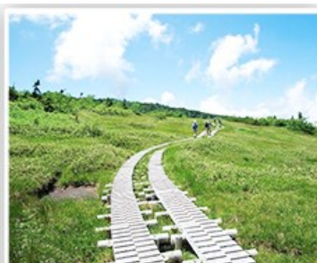
立山黑部~彌陀原高原