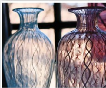
黑壁土藏玻璃工藝