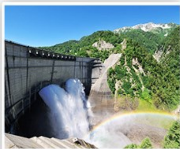
立山黑部~黑部水壩