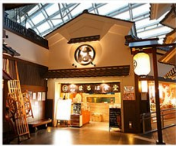
大正江戸時代商店街