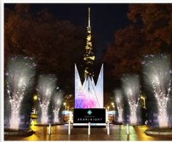
名古屋閃亮夜燈飾慶典