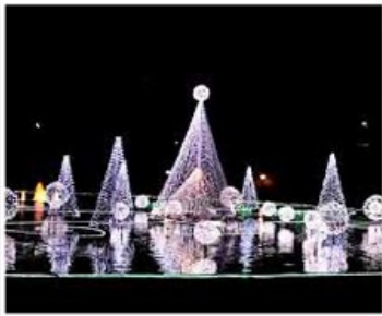
名古屋閃亮夜燈飾慶典