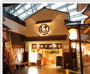
大正江戸時代商店街