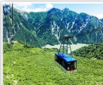
立山黑部~大觀峰纜車