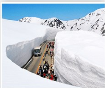
立山黑部~室堂雪牆

【立山每月平均溫度參考】04月份景緻：雪牆、溫度-5 ~ 10℃、05 ~ 06月份景緻：雪牆&新綠、溫度7 ~ 15℃