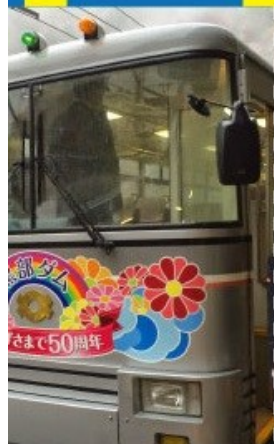
關電隧道無軌電車