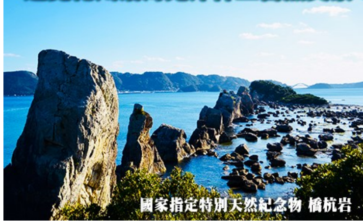
國家指定特別天然紀念物 橋杭岩