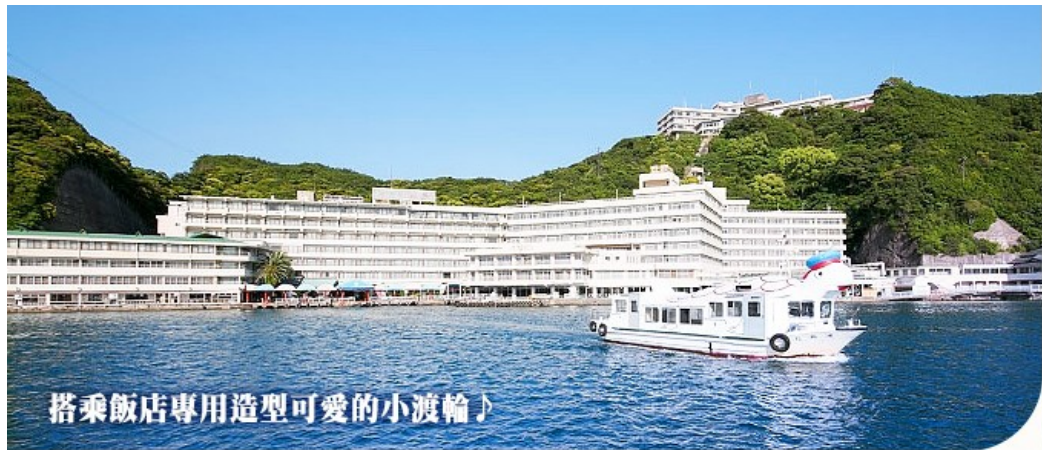
搭乘飯店專用造型可愛的小渡輪♪