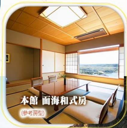
本館 面海和式房 (參考房型)