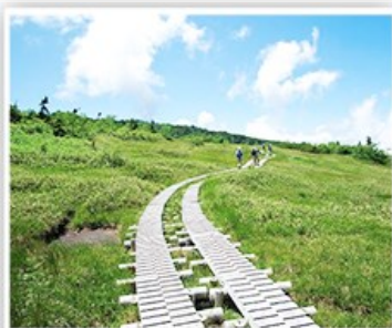
立山黑部~彌陀原高原