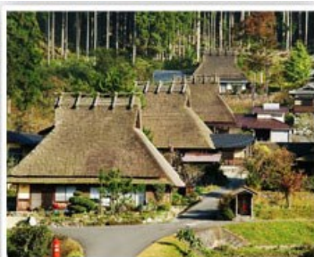
美山町合掌屋聚落