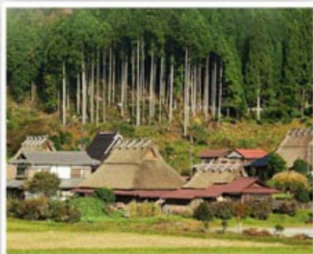
美山町合掌屋聚落