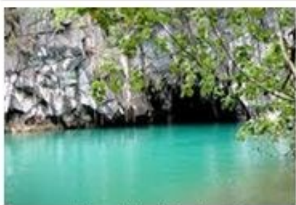
海底河流國家公園

·空中飛人滑索行程，15歲以下兒童或體重未達35公斤旅客，因顧及安全性問題，不能搭乘。