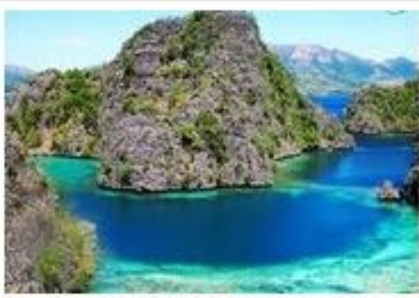
沙邦聖保羅國家公園