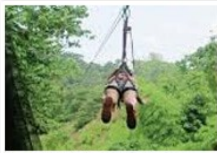
叢林滑翔高空吊索