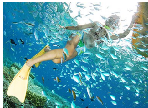
七彩魚世界Color Fish World 與色彩繽紛的熱帶魚們悠游