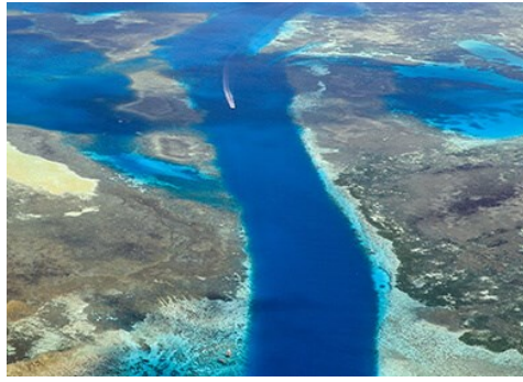
德國水道German Channel 帛琉最美七色海！