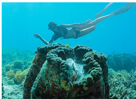
巨型干貝城Giant Clam 蔚藍海平面下的百年碑碣貝