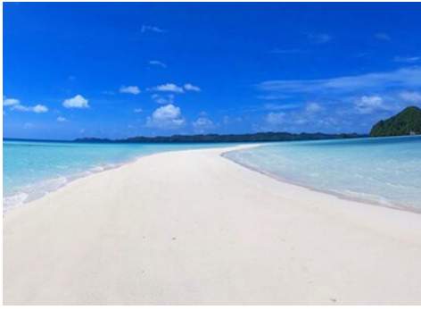
長沙灘Long Beach 退潮限定！帛琉隱藏版夢幻長沙灘