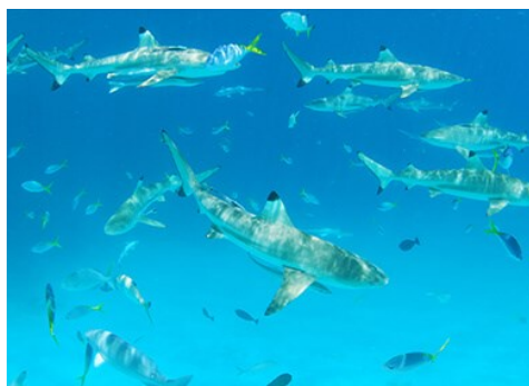
鯊魚城Shark City 在全球第一個鯊魚保護區與鯊共舞