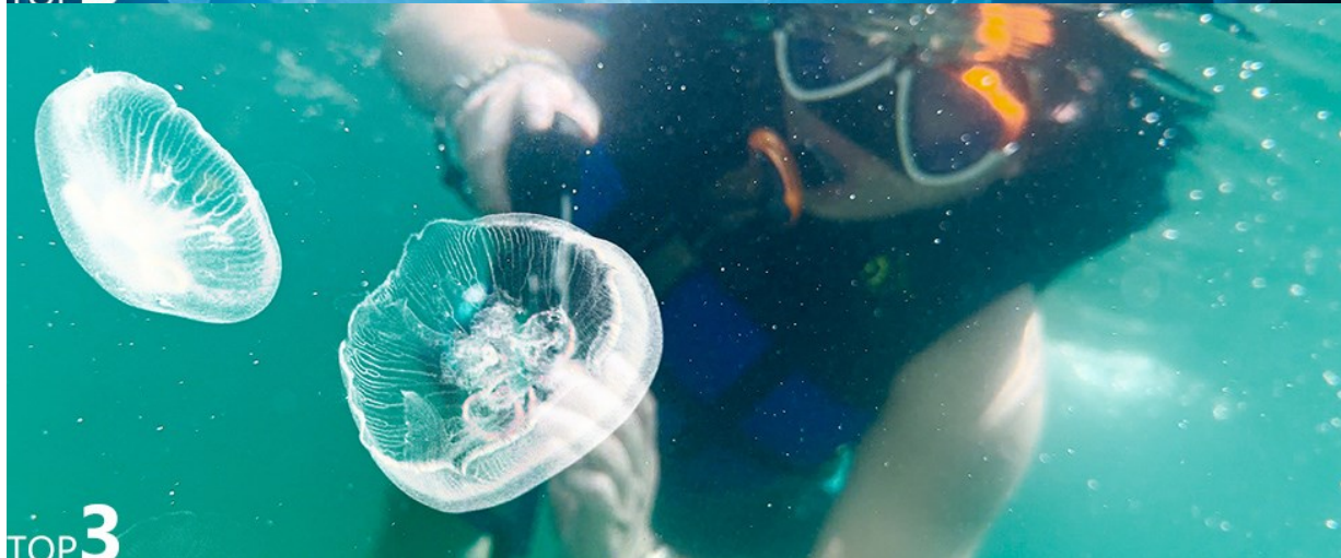
水母湖Jellyfish Lake 被數水母佔領的夢幻內太空