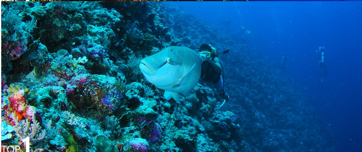
大斷層 Big Drop-off- 探世界七大潛點之首的驚世之美