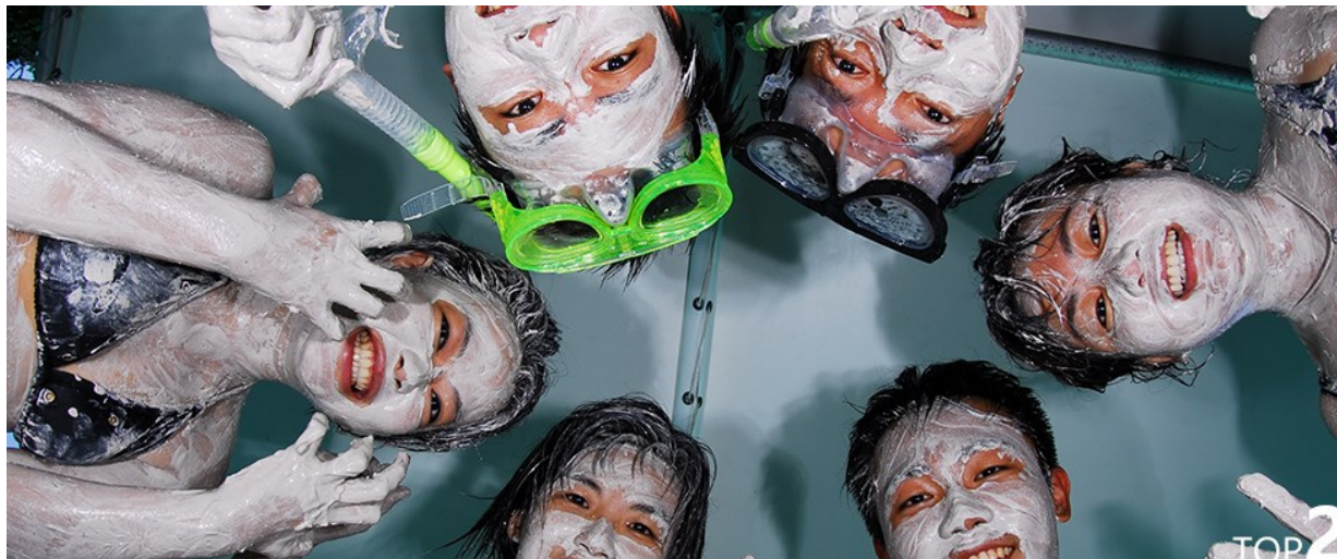
牛奶湖Milk Lake 佐Tiffany藍的天然火山泥美肌SPA