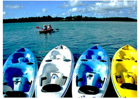
碑磑灣獨木舟+SUP canoe & SUP 網美最愛！透明的才好玩！