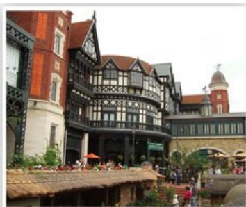
白色戀人巧克力屋

今晚住宿於札幌，您可自由前往頗負盛名又熱鬧的【狸小路】逛街，這裡約有130年悠久歷史，從服飾店、土產店市場到飲食店共有200多家，每家店都各有特色。