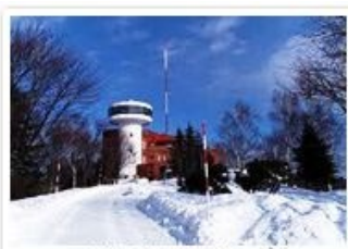
網走天部山道氷館