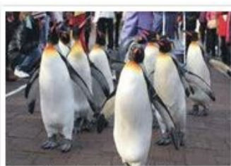
登別海洋公園尼克斯