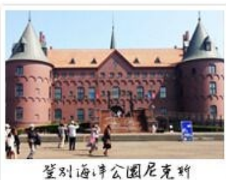
登別海洋公園尼克斯