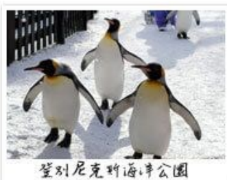
登別尼克斯海洋公園