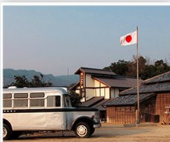
二十四之瞳映畫村