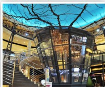
二十世紀梨博物館