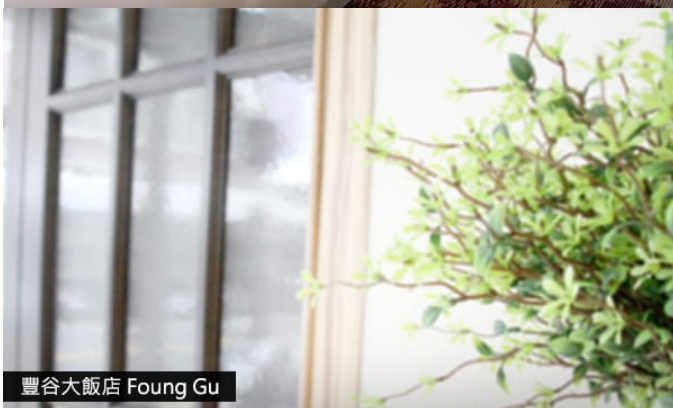
豐谷大飯店 Fong Gu