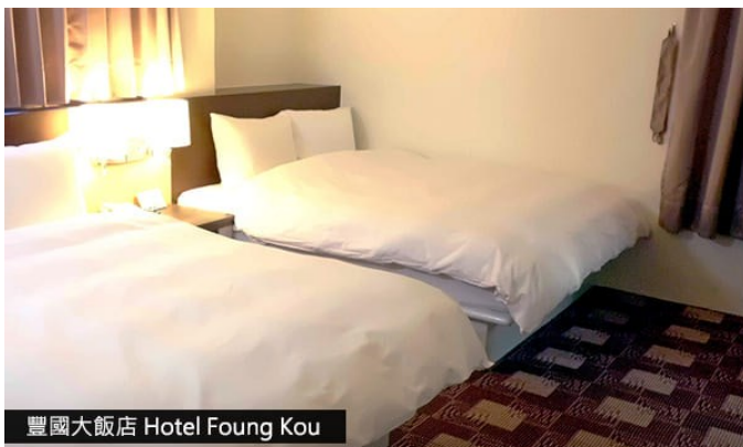
豐國大飯店 Hotel Fong Kou