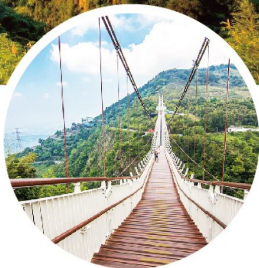
Taiping Suspension Bridge