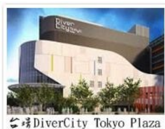
台場DiverCity Tokyo Plaza