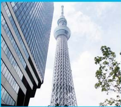
天空樹・東京晴空塔