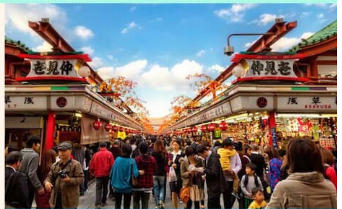
淺草觀音及仲見世商店街