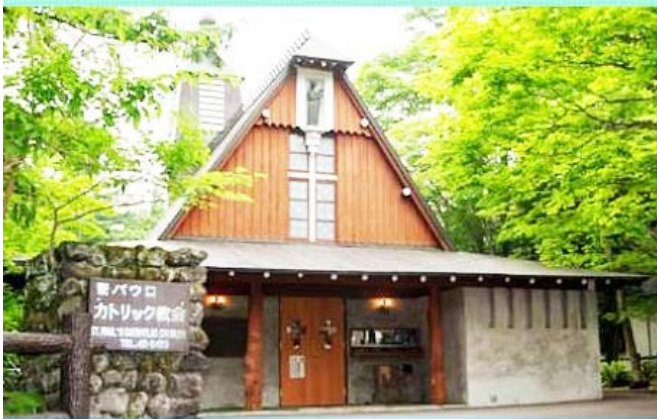
輕井澤散策～聖保羅教堂