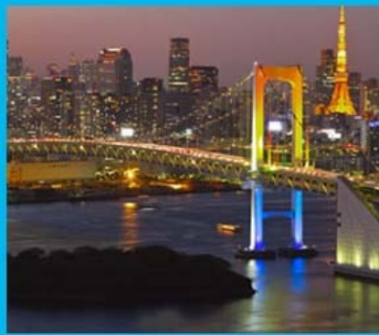
御台場海濱浪漫遊