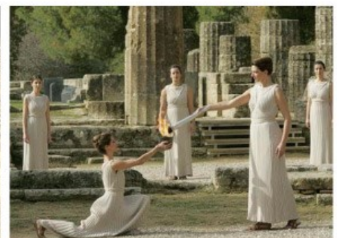
▲ 奧林匹克運動場遺址