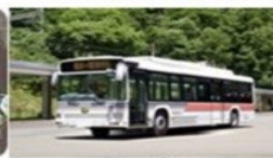
關電隧道電氣巴士