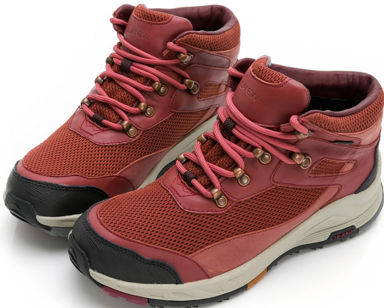
GORE-TEX SURROUND安底防滑郊山鞋 (男款售價：NT$7,980元；女款售價：7,680元)