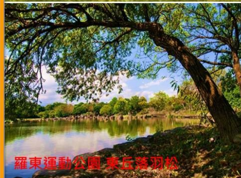
羅東運動公園 東丘落羽松