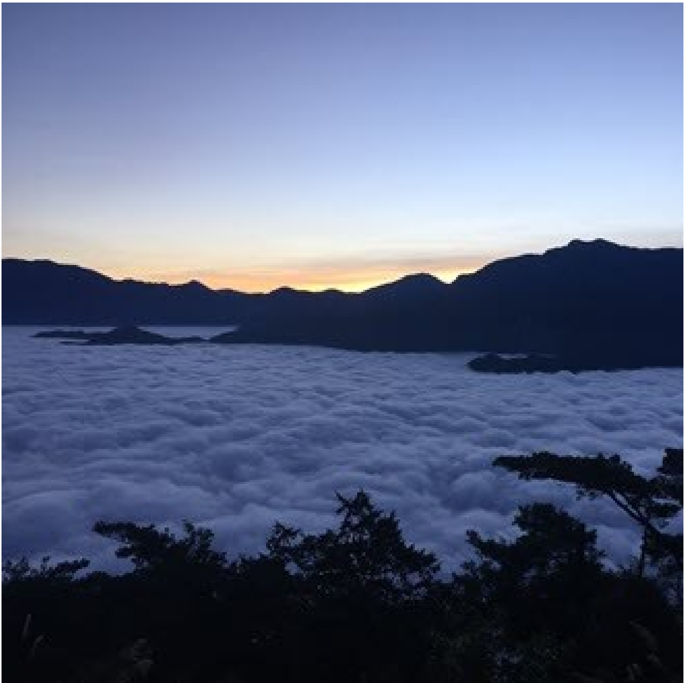
阿里山森林遊樂區