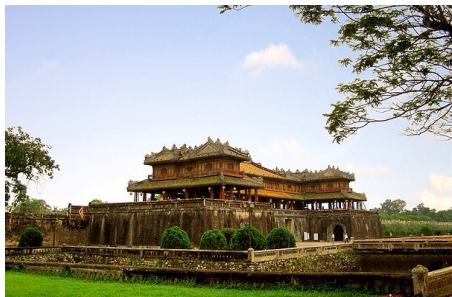
世界遺產 - 順化京城歷史建築群

觀光人力三輪車 ：在皇宮前廣場，搭乘風味獨特的巡遊古皇城周邊市街、近距離的了解古城的風土民情與生活環境。（註：搭乘人力三輪車遊車伴小費，每人30,000越南盾，請旅客備妥費用當地支付。） 順化是阮朝都城，城內及周邊的歷史建築經歷三場戰爭摧殘依然保存完好，是傑出的19世紀建築群。又因其像北京紫禁城般的異曲同工之妙；聯合國科教文組織於1993年認定順化京城（順化歷史建築群）為世界文化遺產。 早餐：酒店內用 午餐：順化風味餐US$10(含可樂或啤酒一瓶) 晚餐：順化中越式餐廳US$10(含可樂或啤酒一瓶)