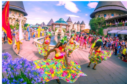
法國山城Ba Na Hills