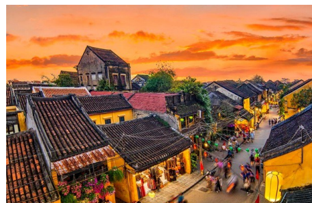
世界遺產 - 會安古城

相較於越南南部胡志明市的「耶穌聖心堂」，岬港的耶穌聖心主教座堂並沒有那麼的「粉」更偏膚色、橘色一些，色調更加沉穩。要注意的是，耶穌聖心主教座堂不只是一個古蹟打卡景點，它同時也是真正還在活躍、使用中的當地信仰集會所，會有固定時間進行彌撒。也因為這邊除了是景點，更是岬港當地信徒的信仰中心。