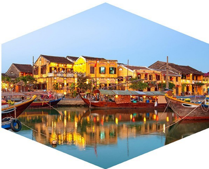
World Heritage in Vietnam