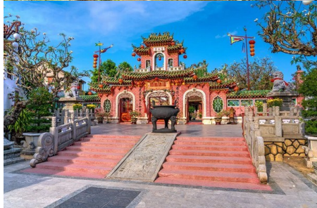
會安古鎮-福建會館

越南島位於會安對岸，會安秋盆河一條蜿蜒的泰國與越南邊境地帶橫穿越南的河流，河道水質景色美不勝收。秋季河邊以這則古鎮林立，對岸也就是越南島還有未開發，是一片原始的原始自然美景風光，岸上密布著水腳樹、椰子樹、島上居民多以捕魚及木雕維生，就讓我們體驗這片原始自然美景風光，開始自然生態風光，及體驗樂於遊玩趣。 船：船費約推知小費含入20,000越幣或1美金，至於船費需按著市價支付。