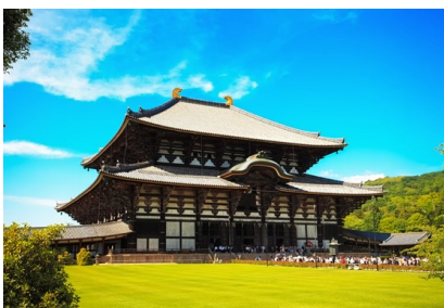
世界文化遺產 東大寺

◆【奈良町格子之家】保留傳統奈良人的生活智慧，這些長條型木造老房子被稱為「鰻の寢床」，江戶時代房子以面對馬路的寬度課稅，因此當時庶民的房子都蓋成長條形以減輕稅金。奈良町格子之家，保留傳統奈良人的生活智慧，長條型的住家裡有可以感受四季的庭院、欣賞四季變化的奧の間、中的間、店の間、藏（倉庫）等完整町家格局，昔日採光及通風等生活智慧也可一探究竟。PS：若遇奈良町格子之家星期一休館日，行程則改走奈良資料館，參觀館內佛像、各種昔日的看板、古錢、生活用具、美術品等。◆【東大寺】距今約有一千二百多年的歷史，因建築在當時首都平城京以東，所以被稱作東大寺。由信奉佛教的聖武天皇建立，大佛殿寬五十七米、深五十米、高四十八米，為現今世界上最大的木造結構建築。優美的建築和法相莊嚴的佛像，讓來自世界各地的觀光客讚嘆不已，一九九八年作為「古奈良的歷史遺跡」之組成部份，被聯合國列為世界文化遺產。該寺之享盛名，乃因寺內的大鐘和大佛；此寺建築於743年，目前為全世界最古的木造建築物。東大寺無論是在建築、雕刻、藝術文物，在日本美術史上都佔有特殊的地位。大佛殿中的木造結構氣宇非凡、氣勢雄偉，木造工藝令人嘆為觀止，光一根大柱，竟需三個成人環抱才行！有趣的是，有根大柱底下有一孔，恰能通人，聽說傳過此洞，能保佑平安。不過，最好有人在另一端幫忙，以免卡住就尷尬了！◆【梅花鹿公園】又稱奈良公園，大正十一年(1922)起被正式指定為國家級名勝，總面積六百六十公頃。奈良公園最引人注目的當非梅花鹿莫屬，這些鹿是春日大社祭神之物，被視為神祇化身園內，現有一千兩百頭，是日本梅花鹿最集中的地方。潺潺溪流和池塘為公園景色增添色彩，林中隱約可望見寺廟的大屋頂和塔樓；四季景色優美如畫，終年觀光人潮絡繹不絕。◆【RINKU PREMIUM OUTLET】臨空城共分為商業、流通製造、住宅、機場相關、工業用地等多樣化的區域。頂級名牌暢貨中心（PREMIUM OUTLETS）約有200多家知名品牌集聚一堂，為遊客帶來新的購物樂趣。專車前往機場，隨後可自行在機場商店街自由逛街、購物。帶著五天滿滿的回憶和依依不捨的心情，搭乘豪華客機返回溫暖的家，結束此次在日本愉快難忘的日本，在此由衷地感謝您選擇參加，期待攔再相會，祝您旅途愉快，萬事如意！謝謝！