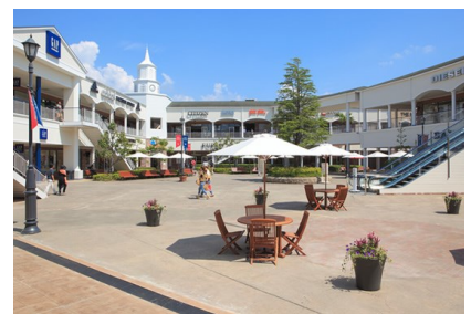
請輸入圖片文字介紹或敘述。