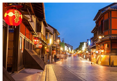
京都祇園花見小路