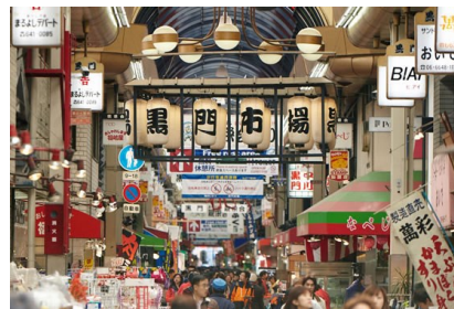
大阪台所~黑門市場