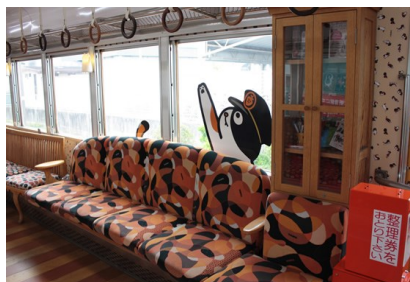
和歌山 貓 電車