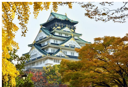
日本三大名城~大阪城