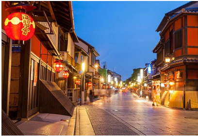
祉園花見小路夜間景色